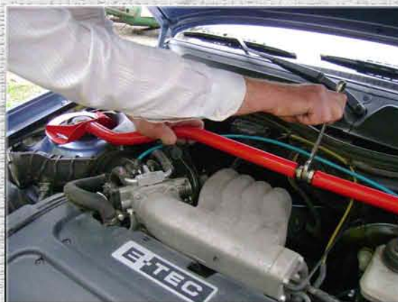
5. Отрегулировать ширину усилителя жесткости с помощью регулировочной шпильки до тех пор пока отверстия на правом кольце не совпадут со шпильками на правой стойке