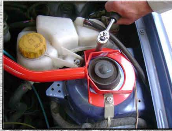
8. Закрутить на левой стойке (стакане, чашке) две гайки M8;