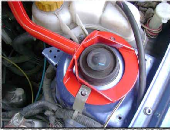
7. Одеть на штатное место кронштейн;