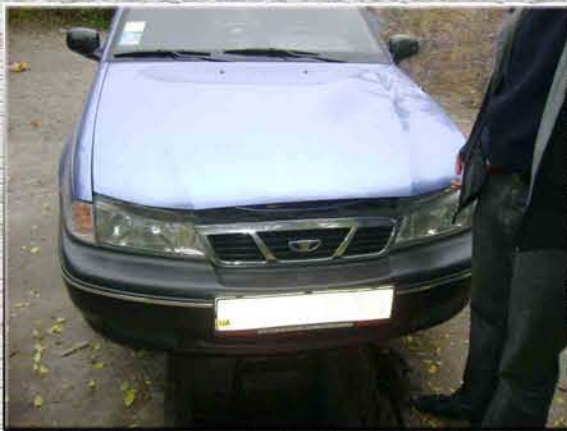
1. Открыть капот автомобиля

Необходимо, чтобы автомобиль находился в неподвижном состоянии на ровной поверхности.