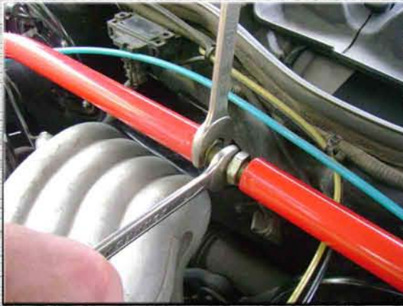
10. Зафиксировать размер усилителя жесткости контрящими гайками на регулировочной шпильке, сначала правой...;