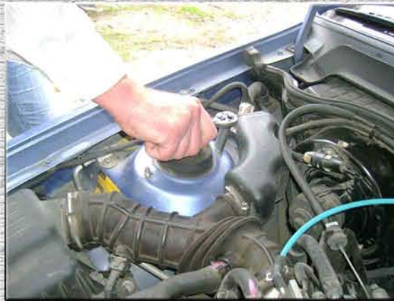
2. Открутить на правой стойке (стакане, чашке) две гайки M8;