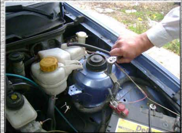
3. Открутить на левой стойке (стакане, чашке) две гайки M8;