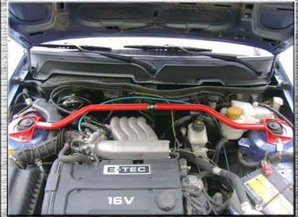
12. Закрывать капот.