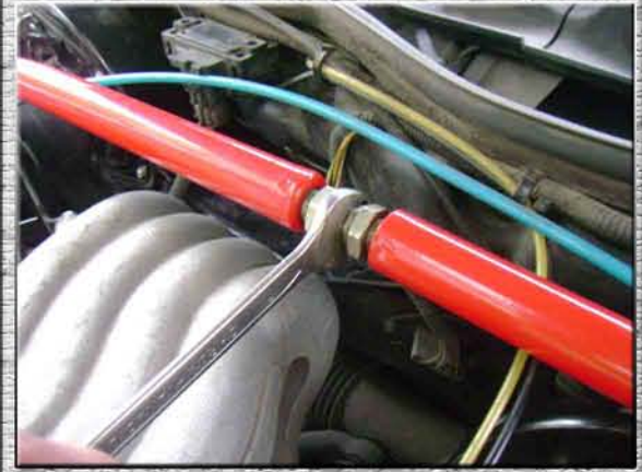
9. Разжать усилитель жесткости регулировочной шпилькой с усилием не более 1кг·с/м