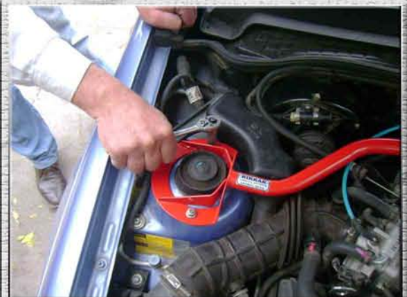
6. Закрутить на правой стойке (стакане, чашке) две гайки M8;