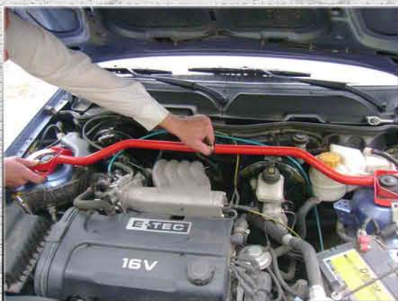
4. Посадить левое кольцо усилителя жесткости на шпильки левой стойки (стакана, чашки);