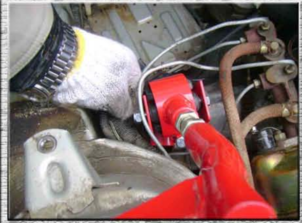
18.Закрутить гайку М10 на кронштейне