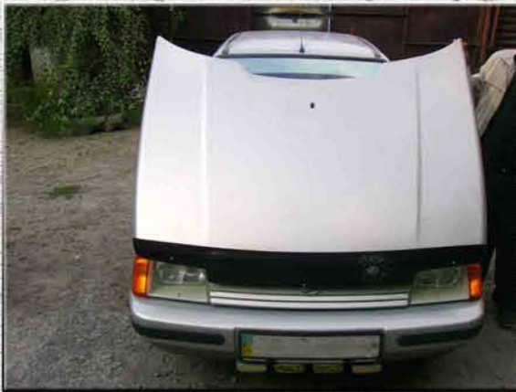
1. Открыть капот автомобиля и снять запаску со штатного места

Необходимо, чтобы автомобиль находился в неподвижном состоянии на ровной поверхности.