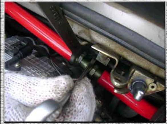
27. Зафиксировать размер усилителя жесткости конtringщей правой гайкой на регулировочной шпильке