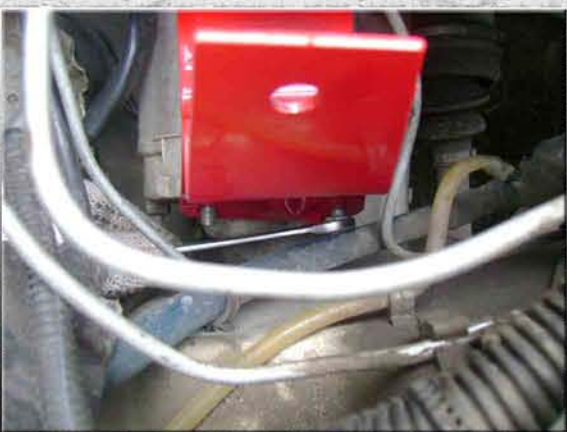
13. Закрутить две гайки М8 на КПП