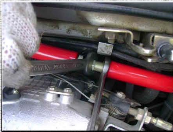
28. Зафиксировать размер усилителя жесткости конtringщей левой гайкой на регулировочной шпильке