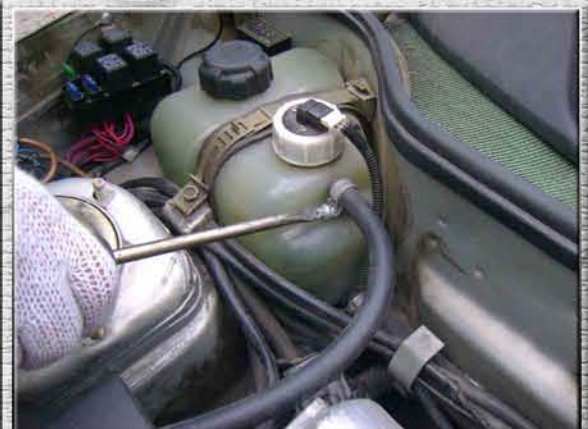
6. Открутить болт хомута на шланге бачка охлаждающей жидкости