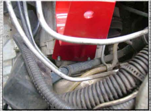
12. Одеть кронштейн усилителя жесткости (без подушки) на две шпильки КПП