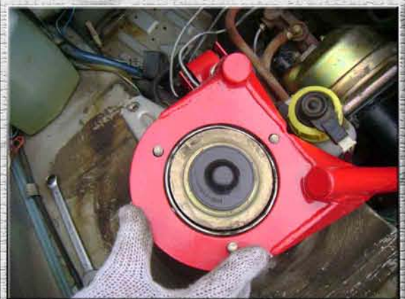
15. Одеть левую часть усилителя жесткости на шпильку левой стойки (стакана, чашки) так, чтобы подушка зашла в кронштейн