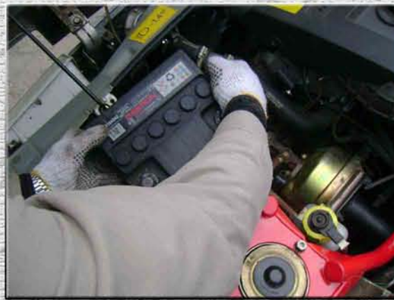
29. Установить аккумулятор на штатное место