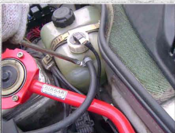
31. Закрутить болт хомута на шланге бачка охлаждающей жидкости