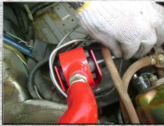
17.Вставить болт М10 в кронштейн