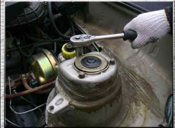
3. Открутить на левой стойке (стакане, чашке) три гайки M8