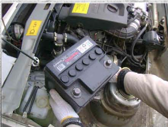
4. Вытянуть аккумулятор со штатного места