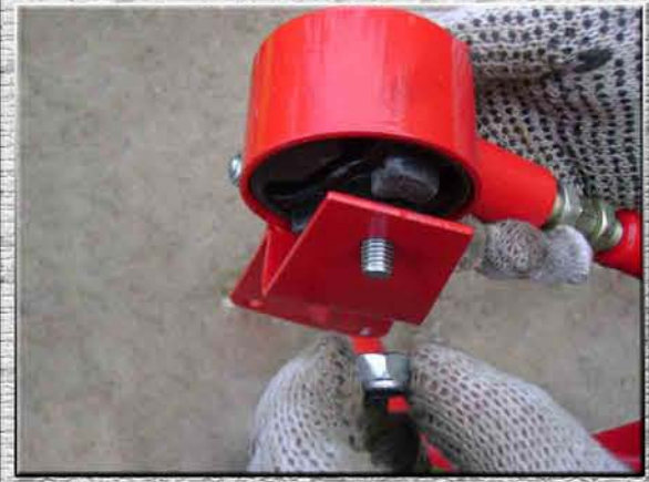
9. Открутить гайку М10 на кронштейне