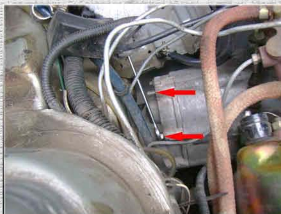
5. Открутить две гайки M8 на коробке передач (КПП)