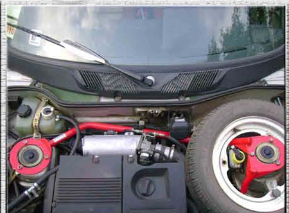
34. Закрыть капот