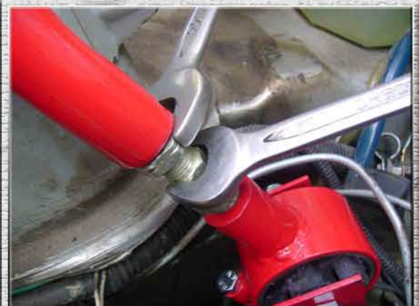
24.Зафиксировать размер подушки контрящей правой гайкой на регулировочной шпильке (стяжке)