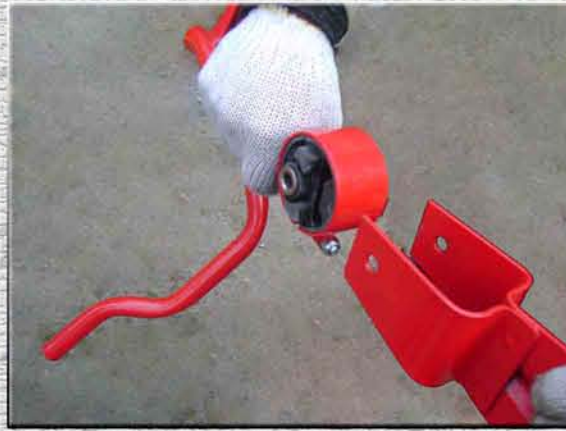
11. Извлечь подушку с кронштейна