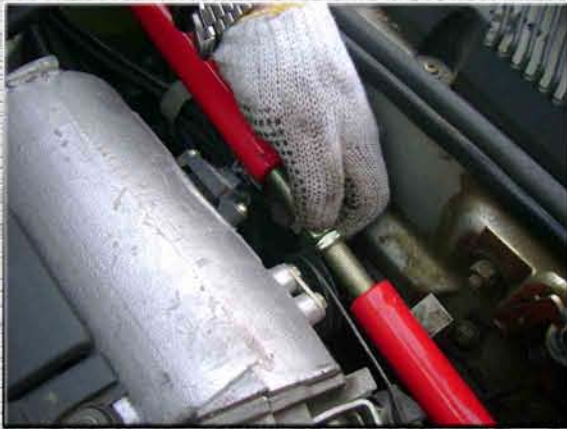
19.Вкрутить шпильку между левой и правой частью усилителя жесткости, чтобы центр шпильки находился, примерно, посередине