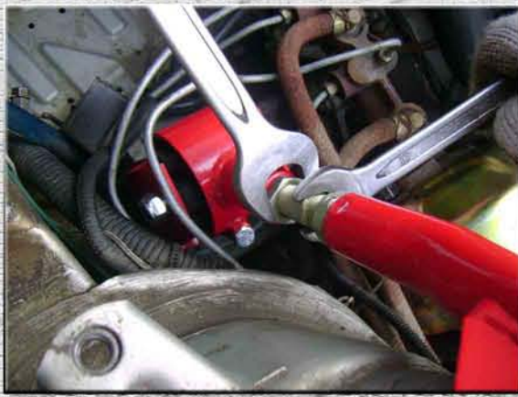
25. Зафиксировать размер подушки конtringщей левой гайкой на регулировочной шпильке