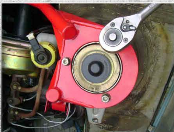
22.Закрутить на левой стойке (стакане, чашке) три гайки М8