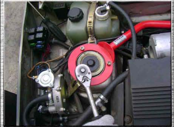
21.Закрутить на правой стойке (стакане, чашке) три гайки М8