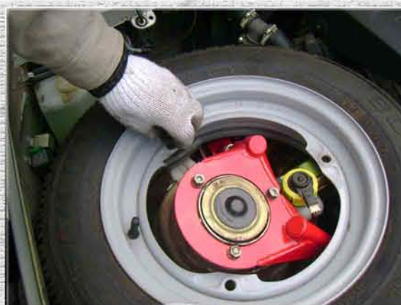
32. Установить запаску на штатное место