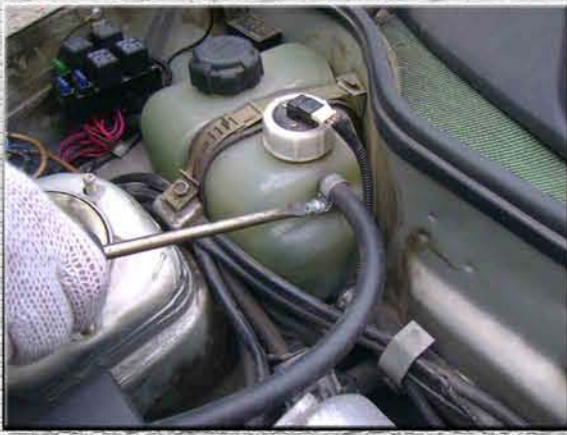
7. Снять шланг на бачке охлаждающей жидкости