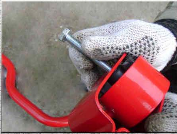
10. Вытянуть болт М10 с кронштейна