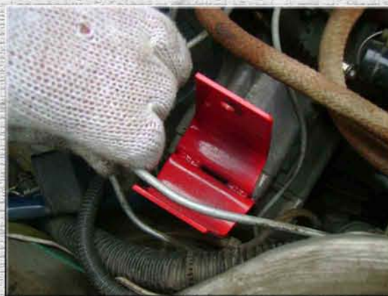
14. Подогнуть руками тормозные трубки для места под подушку (для авто с вакуумным усилителем)