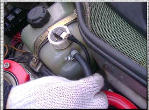
30. Одеть шланг на бачке охлаждающей жидкости