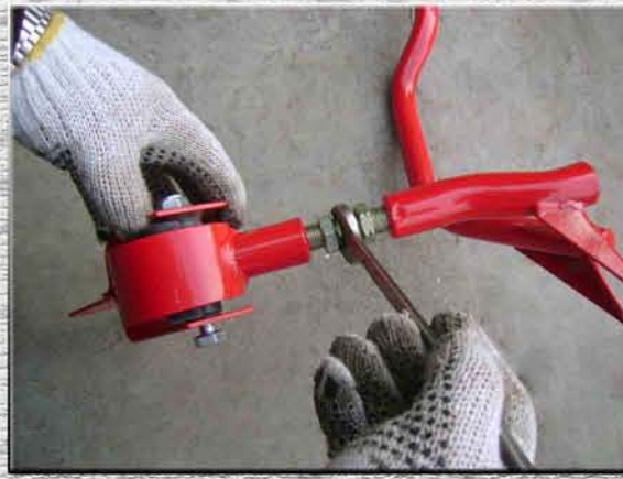
8. Вкрутить шпильку подушки в усилитель жесткости