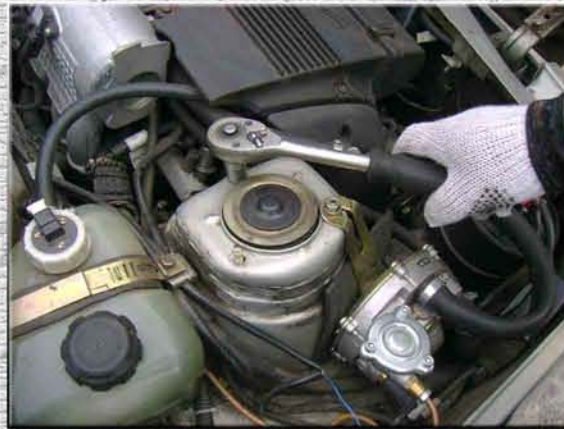
2. Открутить на правой стойке (стакане, чашке) три гайки M8