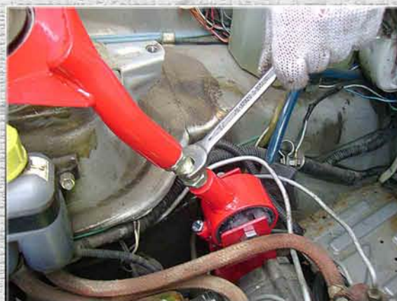
23.Скрутить шпильку подушки ВНИМАНИЕ! Не прилагайте большое усилие, подушка должна поддерживать силовой агрегат, а не поднимать его вверх.