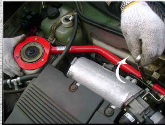
20.Скручивать стяжку до тех пор, пока отверстия на правой части усилителя жесткости не совпадут со шпильками на правой стойке (стакане, чашке), при необходимости воспользоваться ключом