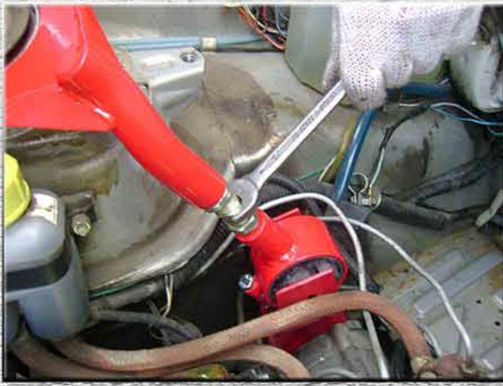
16.Скрутить шпильку подушки, чтобы отверстия в ней совпали с отверстиями кронштейна